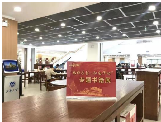
图 2 红色专题书籍展