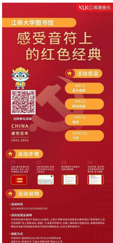
图 2：红色音乐赏析活动