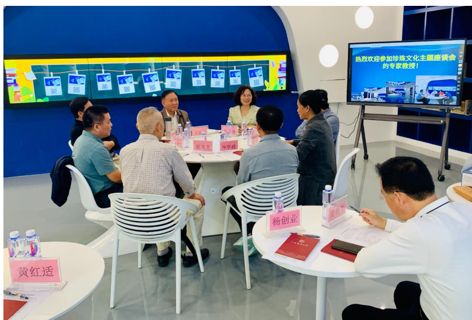
珍珠文化主题座谈会