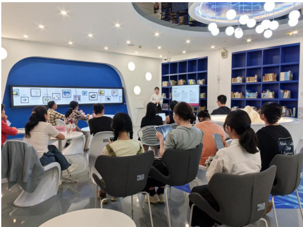
珍珠主题展厅举行读书大赛

该珍珠文化主题展厅，已收集一千余册珍珠相关的书籍，并建成珍珠文化长廊电子显示屏，内容包括珍珠人物、珍珠文献、珍珠相关的视频、珍珠鉴赏等。该展厅为学生培养珍珠文化自信提供一定的保障。